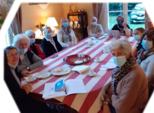
Bilan des bénévoles